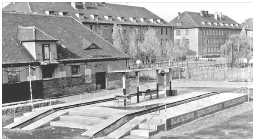
Построенная по моим чертежам «площадка ежедневного обслуживания» для 4-х машин